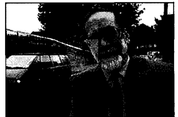
ภาพที่ 1. นายแพทย์ฮาโรลด์ ชิพแมน ก่อนถูกจับกุมตัว.

มิใช่นิยายหรือเรื่องที่สมมติขึ้น แต่ก็คือเหตุการณ์ที่เกิดขึ้นจริงแต่ปรากฏเป็นข่าวภายหลังวันที่ 5 มกราคม 2544 ที่ผ่านมา เมื่อมีคำพิพากษาของศาลในประเทศอังกฤษว่า คุณหมอฮาโรลด์ ชิพแมน (Harold Shipman) แพทย์เวชปฏิบัติ วัย 55 ปี แห่งตำบลไฮด์ (Hyde) เมืองแมนเชสเตอร์ ได้กระทำความผิดในข้อหาจงใจฆ่าผู้ป่วยของตนเองเสียชีวิต ในจำนวนที่พิสูจน์ได้อย่างน้อย 15 ราย และถูกตัดสินลงโทษจำคุกตลอดชีวิต.